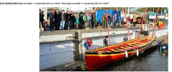
De sloep werd te water gelaten op zaterdag 11 november 2014.