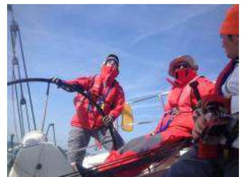
Formation des cadres navigants : Navigation en mer et traversée vers Ramsgate en avril