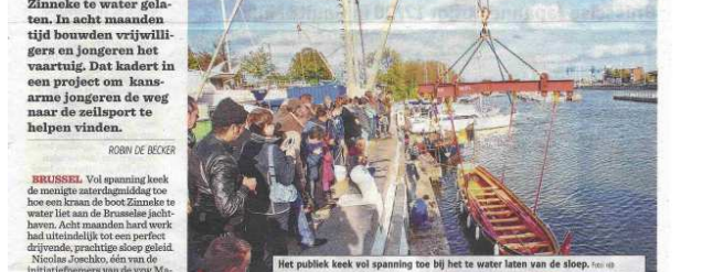
Het publiek keek vol spanning toe bij het te water laten van de sloep.

In de jachthaven van Brussel werd de Bantry Bay sloep Zinneke te water gelaten. In acht maanden tijd bouwden vrijwilligers en jongeren het vaartuig. Dat kadert in een project om kansarme jongeren de weg naar de zeilsport te helpen vinden.