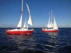
Il est prêt pour le départ des 23 Scouts Maars

L'Atelier Marin, créée fin 2011, a pour objectif de construire et de rénover des bateaux pour les mettre à la disposition d'organisations de jeunesse et permettre à des jeunes démotivés d'accéder aux plaisirs de la voile en cabine. Le principe est que les bateaux sont mis à disposition des organisations gratuitement et en contrepartie, on demande qu'ils contribuent aux travaux d'entretien ou - dans un deuxième temps - qu'ils participent à encadrer d'autres jeunes. Après une première séance où nous avons ainsi pu offrir 818 jours-homme de bateau, l'Atelier Marin est particulièrement fier du résultat de 2013 : plus de 1000 jours-homme offerts à des jeunes Bruxellois et le doublement des jours d'occupation des bateaux ! La recette de ce succès : une flotte de bateaux complémentaires, des jeunes enthousiastes, un support financier et logistique de plusieurs partenaires et une bonne dose d'énergie (et de patience) de la part des principaux acteurs de l'association.