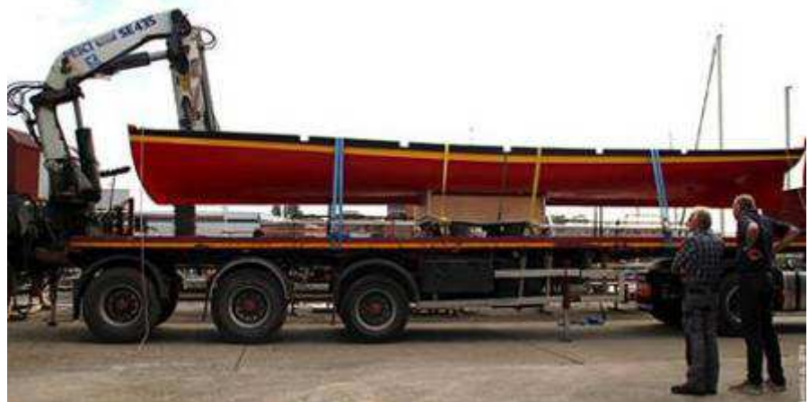
4 octobre : transport du BYRRH vers le BRYC